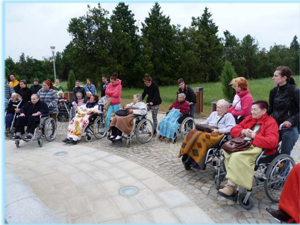
22. květen 2015 - Výlet do Lednice - návštěva lázeňské kolonády